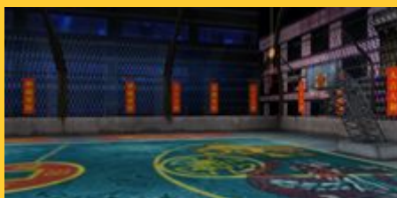
高架下(現フリスタフォルダに格納 . アップデート三弾で実装?)