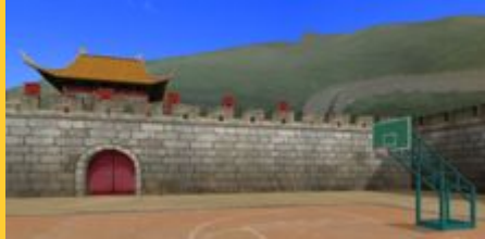
シルクロード(夕方)