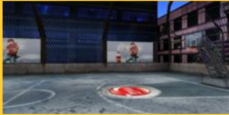
シルクロード(昼間)