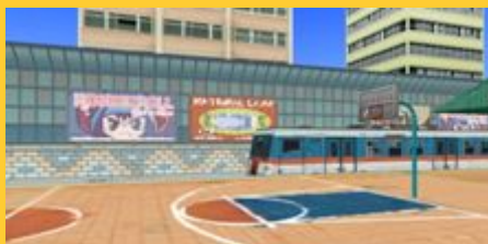
ホワイトコート(ホワイトビッグフロー, スノーヤード)