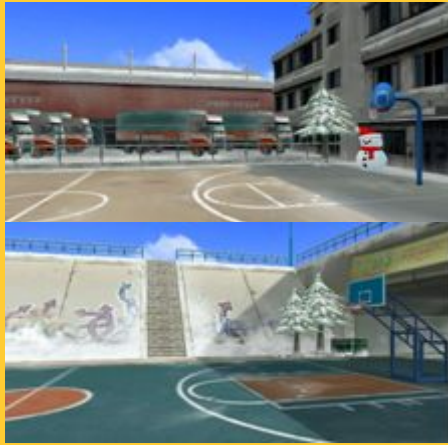
ルーフビルディング昼間ver