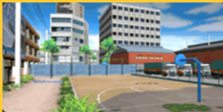
ホワイトワールド