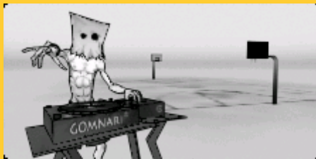
サンセットビーチ