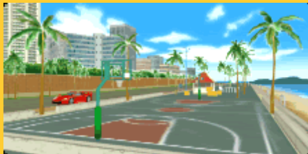
ウォーターボーイズ