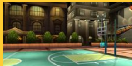
コカコーラ(ルーフビルディング装飾版)