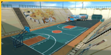
ファクトリーヤード