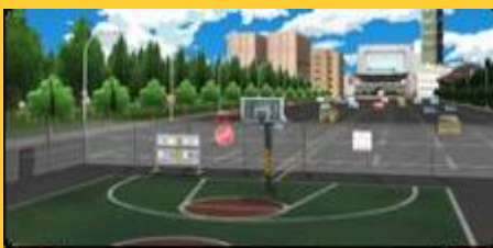
旧正月?(ルーフビルディング装飾版)