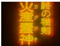
各国の『ファイナルシーク レットソード』

「...」「...」「.....」 ノお馬鹿な～の \ (まさかの師 匠) ドアラが出てきた！ヒロシ木切ら れた！ ホワイト オムレツ