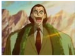
各国の『オニワバ ンスタイル』

平均 勤務 六年 笑って 大蛇 平成のNEETっ子達！ 金 金 金 金はどこ！？