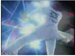
各国の『飛天御剣流』 ～ずっとミツルギのターン～

ぷぴろ ぷっぴ～ろ (老後が)ふあーん！！ かなりクオリティ高い！ ルイズと言ったら梱包にせいっ バ-0-! ワキアイアイアイ