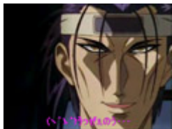
各国の『新撰組三番隊組長』

冥界のお客様! 新鮮グミ! This is 長門 ... まだ早えぞ少年!! 早くしてよ(・`・´)