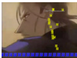
各国の『志々雄真実!その首、貰った!』

、。、。 おあ`う` あ`う` あ`う` あ`ッ!!! へニヨへニヨやて! 怖いよCCOにゃん... セレブだなあ... もういいよ!(・`・´#)