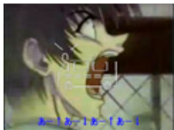
各国の『天剣の宗 次郎』

受付先 西口 山駆ける龍のよろめき あー あー あー あー てえへんだあ～！ 普通龍閃、ああ～