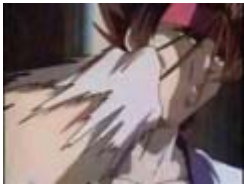
各国の『左之助VS藤田五郎(斎藤)の再戦』

字幕職人によるHP増減 が～ちゃ～ぼんっ I want love you... ヲヲ (。°`´) !! チルノカップ出る！