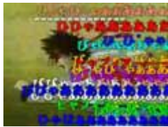
各国の『御庭番衆 御頭』

ヒヤヒヤアー(°。`)ーッ!! ぷぴぽ～ 左之助、ノロい！ サノ、ノーパンサーフィンす！ オニワバングループ(株)