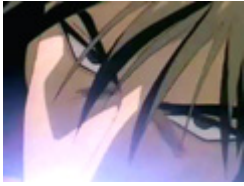
各国の『ヒテンミツルギスタイル』 ～比古ver.～

お取り寄せッ！！ おかしいな... 突っついとけ！ 鈴木イーッ!!! やらないか