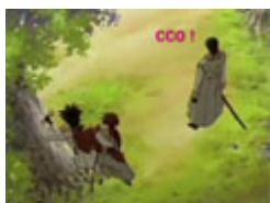
各国の『潜った修羅場の数』

アホーガ (\ ^ > ^ ) < 鼻炎鼻炎 サイト(笑) > (・`・´) ワwwwワwwwワwww ノーパンすっきり ガール