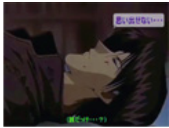
各国の『剣心と蒼紫の再戦』を勝手に補完

大人向け!! 母ちゃん...いねえんすよ! 刺身...ポーク...シャケ上...ター ニヤ フルチン...剣舞...どこ県? エロ奥義 エステのヒテンミツル ギ~