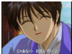
各国の『紀尾井坂 の変』

剣心と宗次郎、由美と 左之助の掛け合いが見 所 後半にめけーも(スペ イン版終幕の一部)収 録 「龍のよろめき」 「動きがベッキー」 は本来別のシーンでの 台詞 アンケート7位