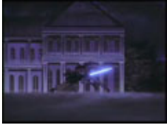
各国の『剣心VS左之助の再戦』

日本語でも多数の空耳を持つ フットバス(市場) アンケート9位(便乗検証中2位)