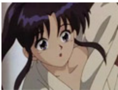
各国の『比留間伍兵衛』

かぴたん！ マルちゃんがいいよマルちゃんです... ＼おマ コー！／ キャプテンセクハラ- - - - -!! かなり天気よす