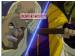
各国の『阿武隈四入道』

I'm 操( )巻き巻き どこのモンゴルマン? 嫁やらん!ワシこんなの嫌! CV:山田花子 ゲイでヲタです