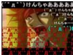
各国の『シーク レットソード』

(°。`)けんちゃあああああああ ん 売れん蟹一な けんちーん！ ロックマン黙れこの野郎... ウニすごいの