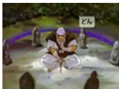
各国の『フタエノ キワミ修行風景』

『心眼の宇水』 『猛 犬の宇水』で 上がっている場合あり アンケート10位(便乗 検証中3位)