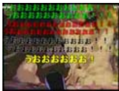
各国の『石動雷十太』

冬を待つ... グレイモン CCO ホモ ソード インポシーびれー! 消えなさい~